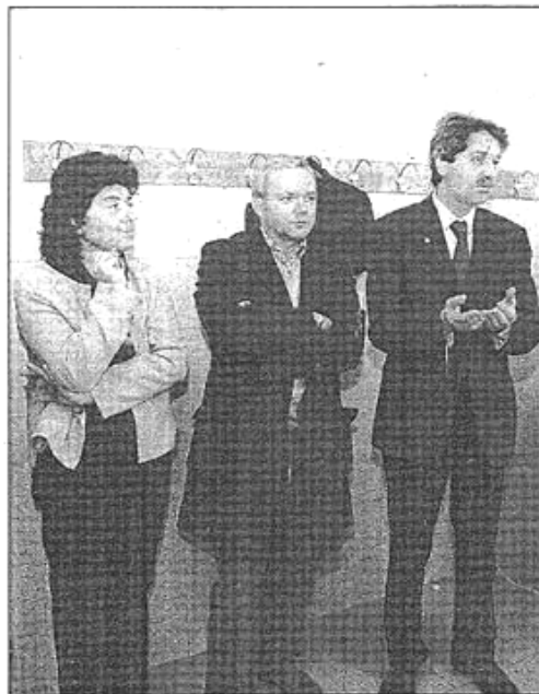
Durante l'inaugurazione sono state annunciate anche nuove collaborazioni strette tra Comune e scuola

Nuove macchine da 26 mila euro: inaugurazione trasmessa in diretta via web