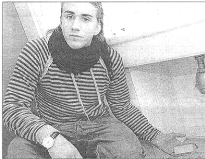
Uno studente dell'istituto Versari mostra alcune delle carenze strutturali nell'attuale sede lungo la via Emilia

sono concatenate. Il "cubo" in fase di costruzione in zona stazione, che sarà pronto prima dell'inizio dell'anno scolastico 2008/2009, da solo, non basterà. Un altro edificio scolastico nuovo, in programma lungo viale Europa, farà quadrare il cerchio, ma i tempi sono incerti e comunque non sarà pronto entro quella data in cui il Versari si aspetta il trasferimento. Forse nel 2010, ma chissà. Perciò gli allievi dell'istituto professionale, insieme al personale e ai genitori, si sono mobilitati con grande energia per dire una cosa chiara: non avrebbero accettato di rimanere in un edificio pericoloso e decentrato, in attesa di una futura scuola, ancora sulla carta. Il "cubo" gli era stato promesso fin dal 1999 e lo volevano, a dispetto delle in-