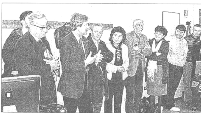
L'inaugurazione alla presenza delle autorità civili e religiose

zature e dalla disponibilità dell'Amministrazione Provinciale che seppur in questi tempi non floridi economicamente ha fornito