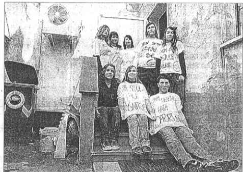
Un ingresso non proprio decoroso Per studenti e docenti trovarsi a studiare e lavorare qua è sempre più demoralizzante