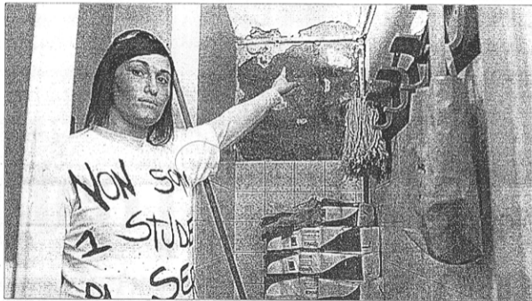
Una studentessa con la maglietta "Non sono uno studente di serie C" mostra le pareti scrostate. Nelle aule non mancano infiltrazioni d'acqua e finestre con gli "spifferi"